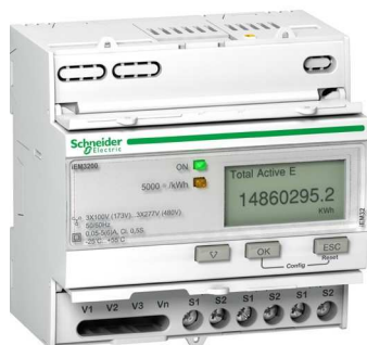
С подключением через трансформаторы тока (1 А / 5 А)