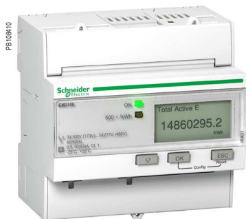
Счетчики электроэнергии серии iEM3100