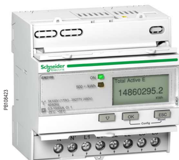
Прямое подключение до 63 А