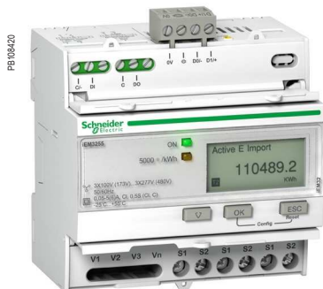
Счетчики электроэнергии серии iEM3255

Счетчики электроэнергии PowerLogic серии iEM3000 сочетают в себе оптимальную стоимость и расширенный функционал. Они монтируются на DIN-рейку и идеальны для субучета и распределения затрат.